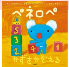
Penelope by Anne Gutman and Georg Hallensleben © Gallimard Jeunesse Licensed by Nippon Animation Co., Ltd.

Anne Gutman(アン・グットマン)、Georg Hallensleben(ゲオルグ・ハレンスレーベン)夫妻によるフランスの絵本シリーズ「Pénélope(ペネロペ)」が原作。日本では2004年に岩崎書店より日本語版絵本の出版が開始され、2013年に原作絵本誕生10周年を迎えました。2006年には、3DCGアニメーション「うっかりペネロペ」としてNHK教育テレビ(現在のEテレ)にて第1シリーズの放送を開始。その後、同局にて毎年再放送があり、現在は第3シリーズを再放送中です。