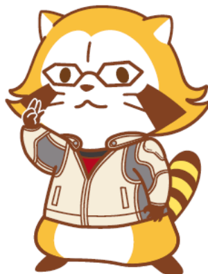
バーナビー・ブルックス Jr.