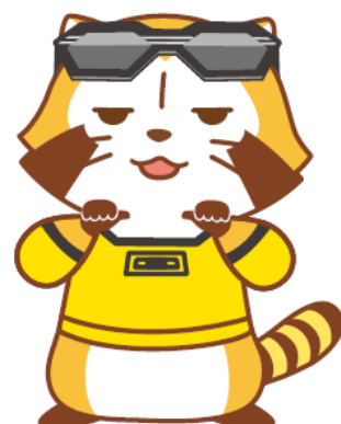
ライアン・ゴールドスミス

虎徹のほか、同作のメインキャラクターであるバーナビー・ブルックス Jr.、ライアン・ゴールドスミスの3人に扮するラスカルのデザインを制作(上記画像)。コラボレーショングッズの発売も決定しており、11月29日(土)より、東京・池袋の「日本アニメーションオフィシャルショップ ANI★CUTE(あに★きゅーと)」にて先行発売いたします。