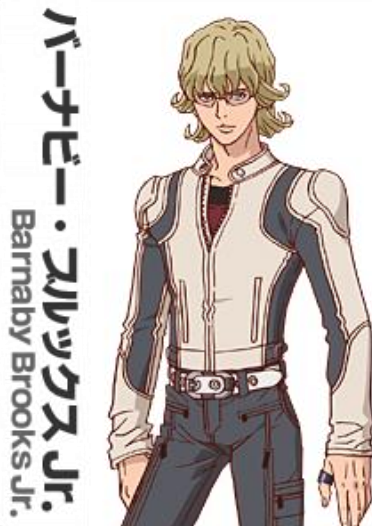
バーナビー・ブルックスJr. Barnaby Brooks Jr.