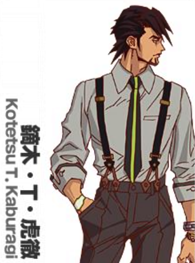
鈴木・T・虎徹 Kotetsu T. Kaburagi