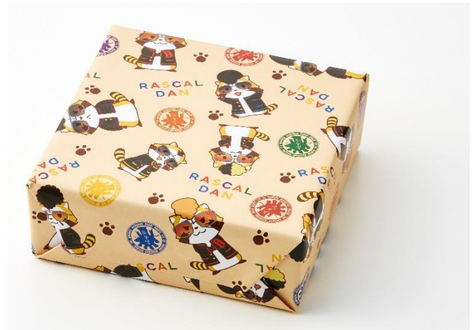
▲包装箱、包装紙には「羅隼華流團」が！