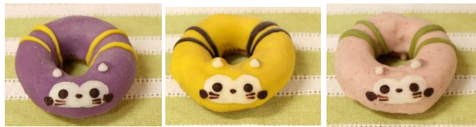
▲ラスカルドーナツ 各320円(税込)