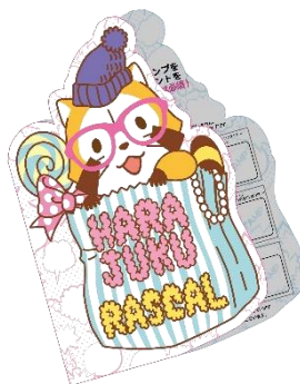
スタンプカード(イメージ)