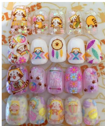
ラスカルネイルシール (スタンダード、スイーツ、Jill&Loversの全3種) 各842円(税込)

渋谷・原宿エリアでロコミ人気No.1のネイルサロン。人気ネイリスト神宮麻実がデザインしたネイルシールを発売。