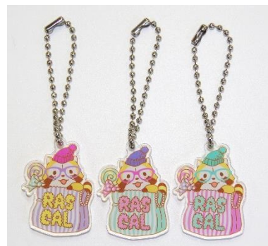
アクリルチャーム