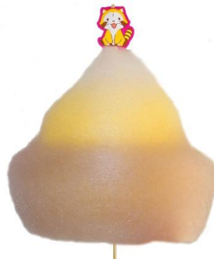
ラスカルコットンキャンディ 550円(税込)