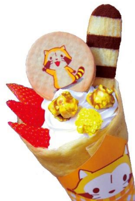
ラスカルクレープ 730円(税込)

今年創業40周年を迎えるマリオンクレープ。トッピングに加え、巻き紙までこだわったコラボクレープを発売。