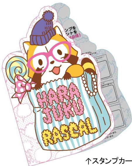
↑スタンプカード(イメージ)

当社は「原宿ラスカルスタンプラリー」の開催にあたり、天然素材ドーナツ専門店「フロresta」、原宿の人気スイーツ店「マリオンクレープ」「サーティワンアイスクリーム」「トッティキャンディファクトリー」、人気ネイルサロン「ジルアンドラバーズ」とライセンス契約を結びました。各ショップにてオリジナルラスカルメニューが発売されます。ラスカルメニューをお買い求めいただくと、1店舗でのお買い物1回につき1つ、スタンプを押印いたします。対象店舗のうち、「原宿ラスカルショップ」内の「フロresta」を含む3店のスタンプを集めていただくと、非売品の「原宿ラスカルチャーム(全3種)」をプレゼントいたします(なくなり次第終了)。