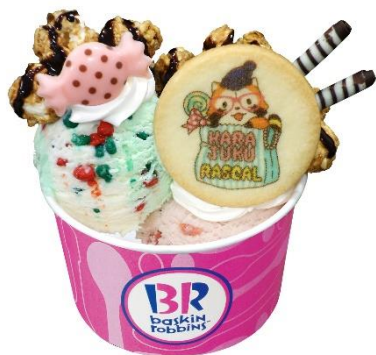
ラスカルサンデー 680円(税込)

好きなフレーバーを2種類選べる、ボリューム満点のコラボレーションサンデーを発売。