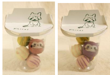
◀カップラスカルドーナツ 各600円(税込)