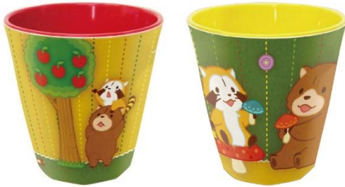
メラミンカップ(2種 各600円+税)