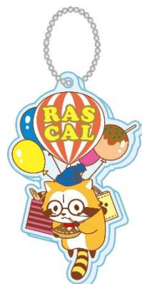
▲「大阪ラスカル」のアクリルキーホルダー