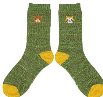
ワンポイントソックス(650円+税)