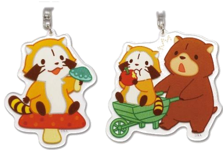
アクリルキーホルダー(2種 各800円+税)