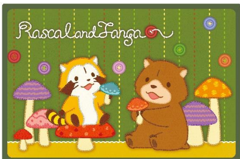
ひざ掛けブランケット(2,100円+税)