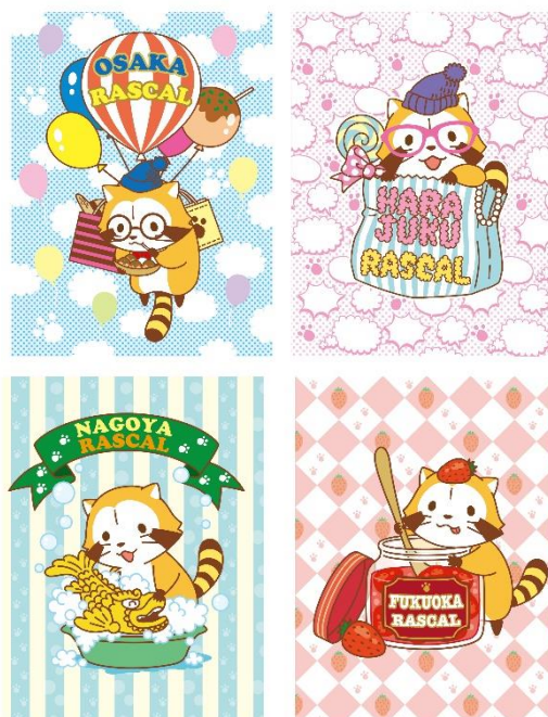
▲エリア限定デザインのラスカル

ノベルティ: 税込1,500円以上お買い上げの方に、 エリア限定デザインのアクリルキーホルダーをプレゼント 原宿店・・・原宿ラスカル／中部エリア店舗・・・名古屋ラスカル／ 関西エリア店舗・・・大阪ラスカル／福岡パルコ店・・・福岡ラスカル