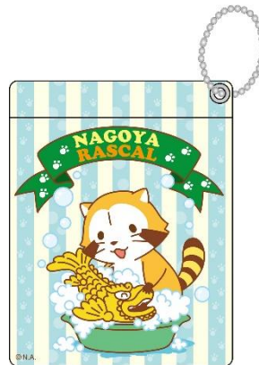
▲「名古屋ラスカル」のバスケース