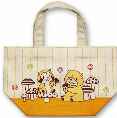
ランチバッグ(2,000円+税)