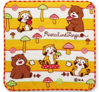
ガーゼハンカチ(700円+税)