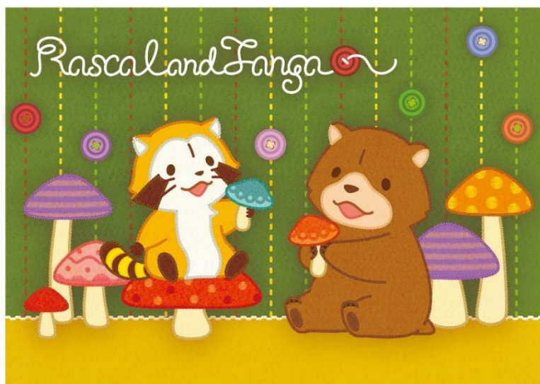
▲新デザインシリーズ「ラスカル&amp;タンガ」

アニメ第22～23話に登場する小熊「タンガ」とラスカルを描いた新デザインシリーズ「ラスカル&タンガ」のグッズを先行販売するほか、「原宿」「名古屋」「大阪」「福岡」をイメージして描き下ろした「エリア限定デザイン」のラスカルグッズをキデイランド限定で販売します。また、「ラスカルフェア」中に税込1,500円以上のお買い物をされた方を対象に、「エリア限定デザイン」のラスカルアクリルキーホルダーを先着でプレゼントいたします。(店舗により、取り扱うデザインが異なります。)