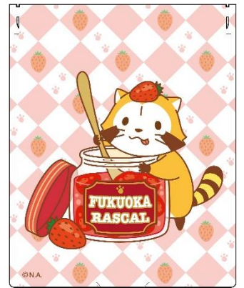
▲「福岡ラスカル」のミラー