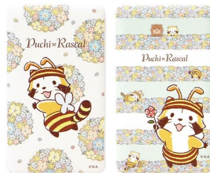
USB出力充電器(全2種) 各3,480円+税