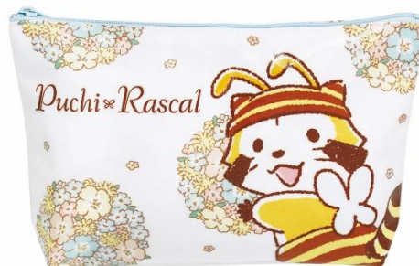
▲プリントポーチ(1,200円+税)