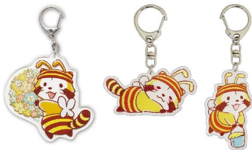
アクリルキーホルダー(全3種) 各700円+税