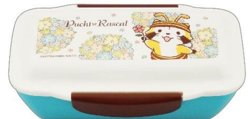
▲ドームランチボックス(1,200円+税)