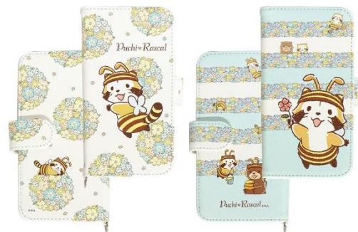
マルチフリップカバー(全2種) 各2,980円+税