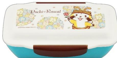
ドームランチボックス 1,200円+税