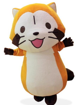
▲原宿店にはラスカルが来店!

※「ラスカルフェア」詳細: http://www.kiddyland.co.jp/event/rascal201704/