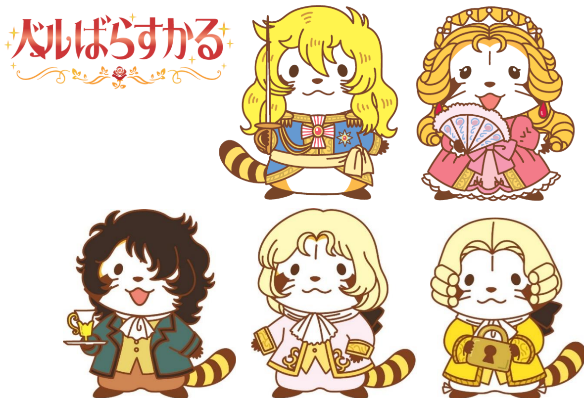
▲左上から時計回りに「オスカル」「マリー・アントワネット」「ルイ16世」「フェルゼン」「アンドレ」

今後の「ベルばらすかる」グッズの発売予定は、「あらいぐまラスカル」公式WEBサイト・SNS等で随時発表してまいります。