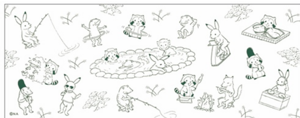
▲日本てぬぐい(1,000円+税)