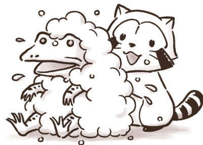
▲カエルを洗うラスカル