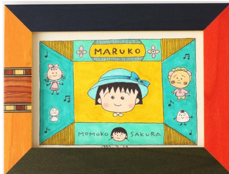
プライベート作品 1997年