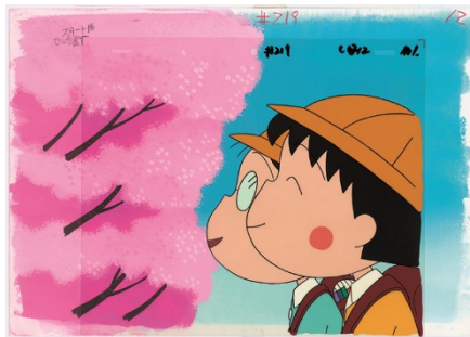
「春の巴川の一日の巻」 セル画 1999年 ©さくらプロダクション/日本アニメーション