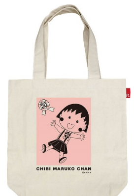
ルートト(全7種) 3,024円(税込) ©さくらプロダクション/ 日本アニメーション