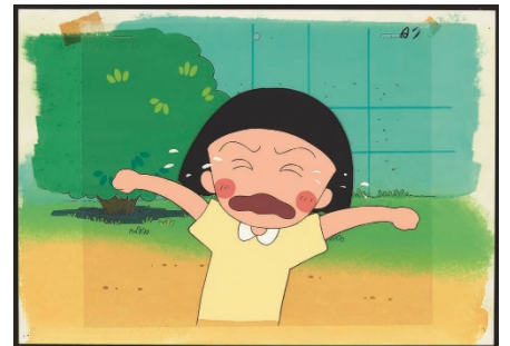
「おかつぱ・かつぱ」の巻 セル画 1990年 ©さくらプロダクション/日本アニメーション