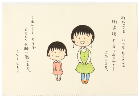
アニメ放送1000回記念 イベント用イラスト 2012年 ©さくらプロダクション