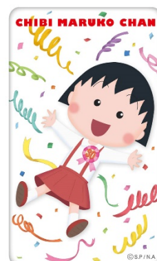
モバイルバッテリー(全2種) 3,996円(税込) ©さくらプロダクション/ 日本アニメーション