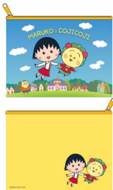
ポーチ(まる子&コジコジ) 1,296円(税込) ©さくらももこ/ さくらプロダクション/ 日本アニメーション