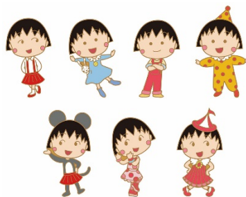
ピンズ(全8種) 各540円(税込) ©さくらプロダクション/ 日本アニメーション