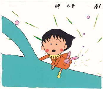
オープニング「うれしい予感」 セル画1995年 ©さくらプロダクション/日本アニメーション