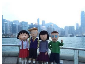
「まるちゃんたちが香港旅行にやって来た！」パレード

2014年11月3日～2015年1月4日の間、アニメ化25周年記念及び原作者・さくらももこの漫画家デビュー30周年記念し、香港の大型ショッピングモール3か所(ウインザーハウス、コーズウェイベイプレイス、ラフォーレ)でイベント&キャンペーンを実施中。物販、「ちびまる子ちゃん」展、キャラクター人気投票企画、記念イベントなどを開催。