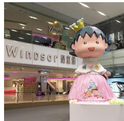
高さ4mの巨大フィギュアを展示