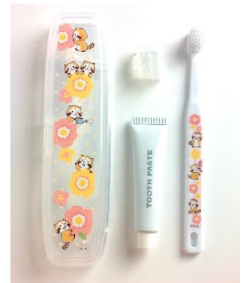
歯ブラシラベルセット 600円+税