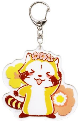
アクリルキーホルダー 700円+税