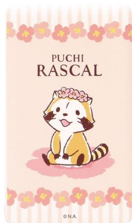
YSBリチウム充電器(全2種) 各3,480円+税