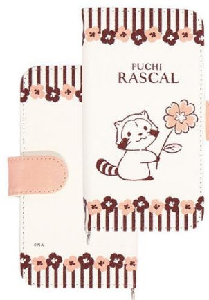
マルチフリップカバー(全2種) 各2,980円+税