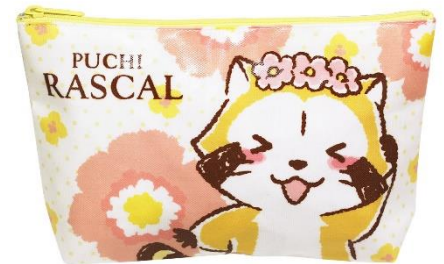
プリントポーチ 1,200円+税