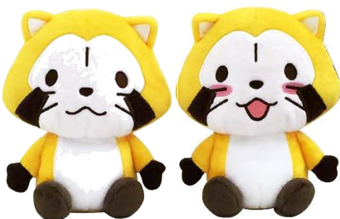
音声ぬいぐるみ(2種 各1,380円+税)