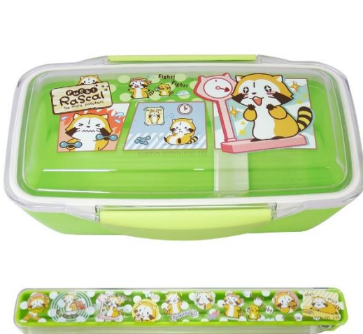
▲【上】ドームランチボックス(1,200円+税) 【下】箸・箸箱セット(600円+税)