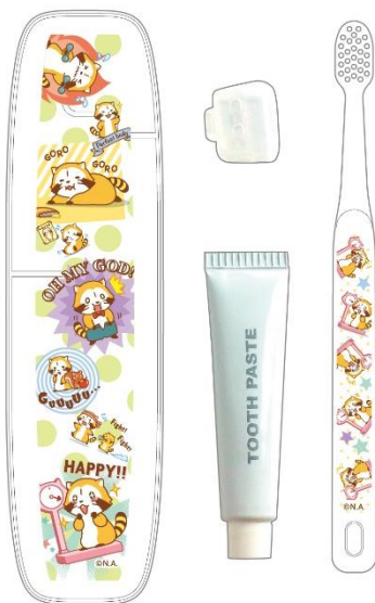
▲歯ブラシラベルセット(600円+税)