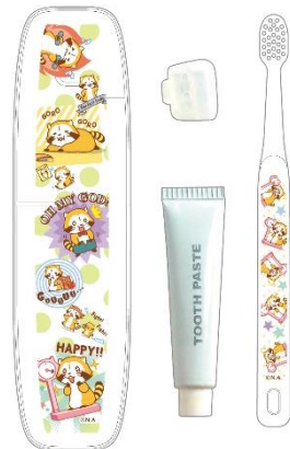
歯ブラシラベルセット(600円+税)