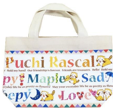
ランチトートバッグ(1,500円+税)