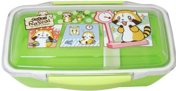
ドームランチボックス(1,200円+税)