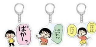
アクリルキーホルダー 各700円(税抜)