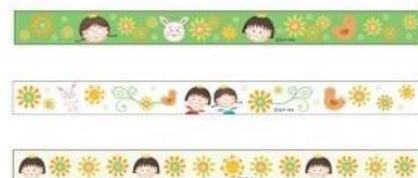
マスキングテープ(3個セット) 602円(税別)