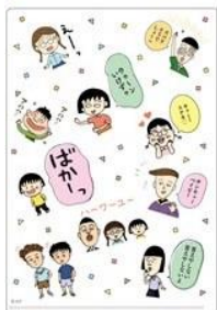
A5クリアファイル 220円(税抜)