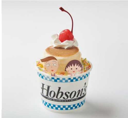
まる子フレーバー ※写真はイメージです。