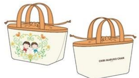
巾着付きランチトート 1,482円(税別)