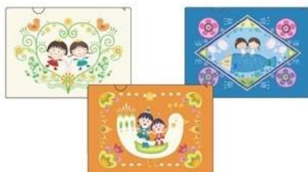
クリアファイル(A4 3枚セット) 556円(税別)