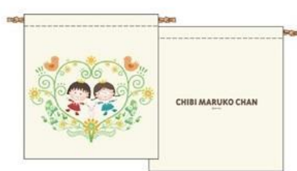
シンプル巾着 649円(税別)