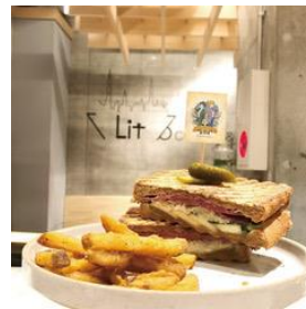
ホットサンド(ポテト付き)