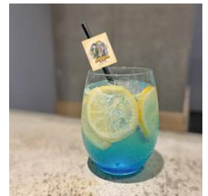
青い空のレモネード