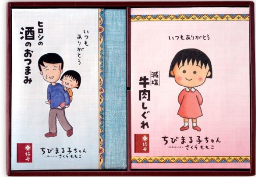
▲『ヒロシの酒のおつまみ 詰合せ』（どら焼入り）