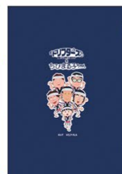
クリアファイル(2種)