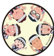
スマホグリップ 1650円