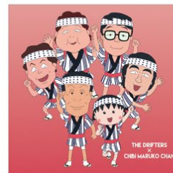
ステッカーセット