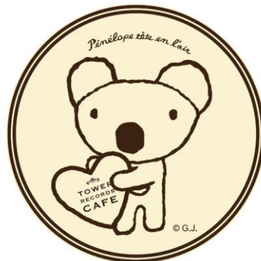
コラボレーションカフェのロゴマーク