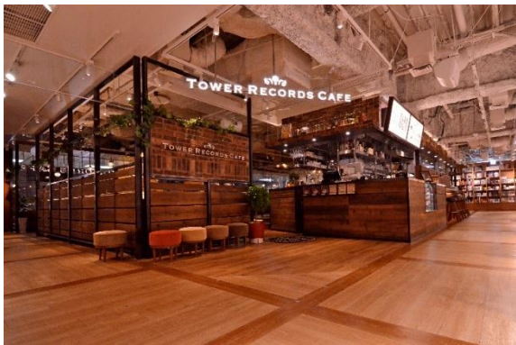
タワーレコード渋谷店2F 「TOWER RECORDS CAFE」

期間中は、フランス生まれの「ペネロペ」をあしらった、おしゃれで可愛いコラボレーションフードやスイーツの提供のほか、店内装飾、ぬいぐるみの展示、撮影スポットのご用意など、カフェ店内は「ペネロペ」でいっぱい。2月7日にはタワーレコード渋谷店でのペネロペ来店イベントの開催も予定しております。イベントの詳細につきましては公式WEBサイト( http://penelope.tv/ )にて発表いたします。