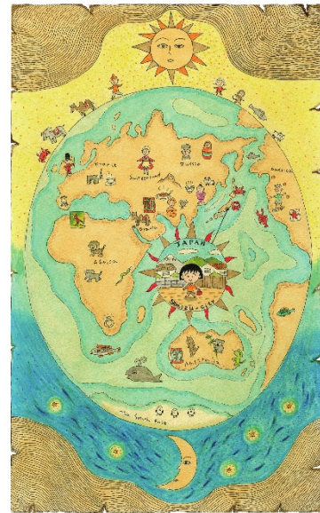
Momoko Sakura meets gelato pique.

【さくらももこ】ワンピース 5,000円+税 ブルー 【さくらももこ】Tシャツ 4,400円+税 ブルー 【さくらももこ】パンツ 5,400円+税 ブルー