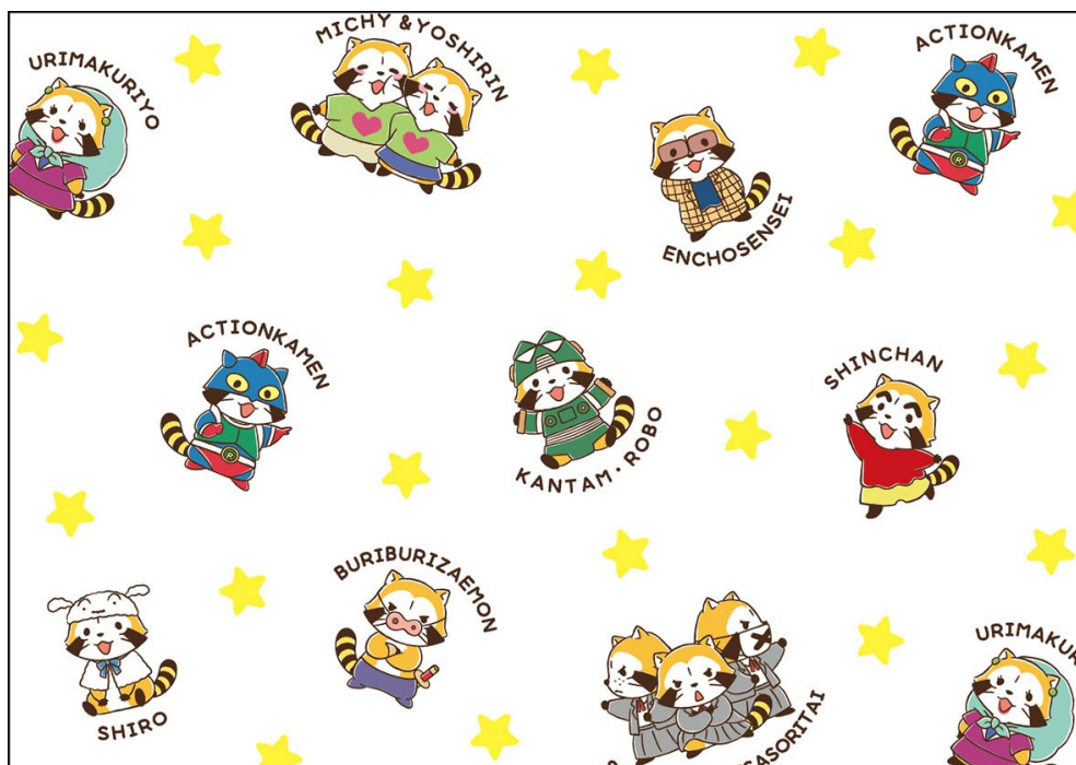
▲ラスカルが「しんちゃん」のキャラクターに！？