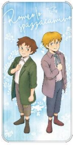
モバイルバッテリー 6,600円