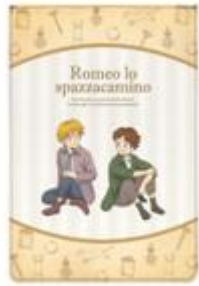
8~11インチタブレット対応 PUレザースリーブケース 2種 各2,200円