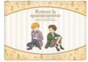
ノートPC用PUレザースリーブケース ~13.5inch 2種 各2,500円

※デザインはイメージです。予告なしに変更になる場合がございます。 ※価格はすべて税込表示です。