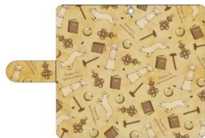
手帳型スマホケース 3,850円