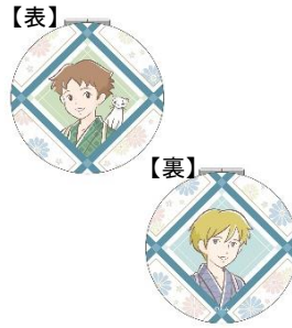
折りたたみミラー 1,430円