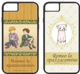
iPhone SE第二世代/8/7/6s/6用 アクリルパネルケース 2種 各2,500円