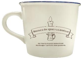
ホーローマグカップ(コースター付) 2,970円