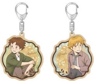
ウッドキーホルダー 2種 各660円