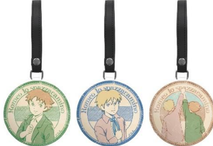
ラゲッジタグ 3種 各1,100円