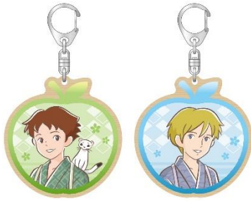
ウッドキーホルダー 2種 各660円