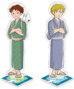
アクリルスタンド 2種 各1,430円