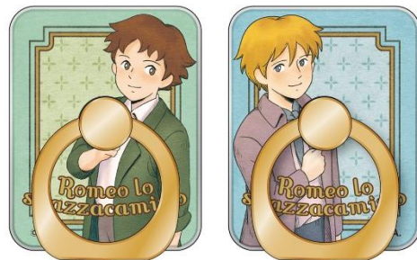
スマホリング 2種 各1,650円