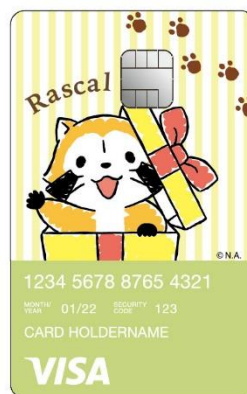
▲オリジナルデザインカード

※詳しくは「Nudge」公式Webサイトをご確認ください。入会の際にはクレジットカードの概要、注意事項などをご確認の上お手続きください。